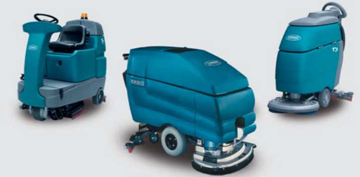
Hersteller Reinigungsmaschinen: Tennant

→ Kehrsaugmaschinen: Überzeugende Sauberkeit unter härtesten Bedingungen – mit konstanter Betriebszeit, optimaler Kehrleistung und Staubkontrolle.