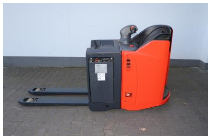
Linde Elektro-Niederhubwagen T20SP-B

Tragkraft: 2.000 kg Baujahr: 2022 Betriebsstunden: 5