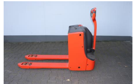
Linde Elektro-Niederhubwagen T16

Tragkraft: 1.600 kg Baujahr: 2020 Betriebsstunden: 5