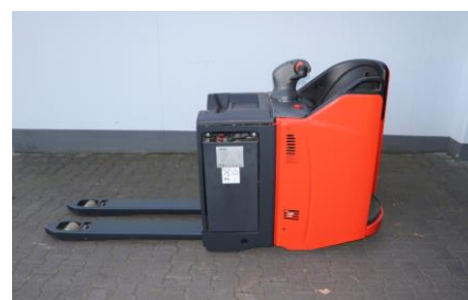
Linde Elektro-Niederhubwagen T20SP-B

Tragkraft: 2.000 kg Baujahr: 2022 Betriebsstunden: 5